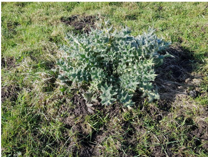
Zaailing van de Speerdistel (foto: 18 maart 2026)

Vorig jaar hebben stonden er verspreid door de polder enkele Speerdistels. Dit zijn vrij forse planten met grijsgroen blad, prachtige bloemen aan lange, vertakte bloeistengels, maar met vlijmscherpe lange naalden. Schapen en koeien lusten ze niet en wanneer de planten in het hooi terechtkomen is dit niet meer goed bruikbaar. Deze planten hebben zich na de bloei vorig jaar enorm uitgebreid. Het vele zaad is met de wind verspreid, waardoor nu op tal van plaatsen nieuwe planten tot ontwikkeling zijn gekomen. Om te voorkomen dat de Speerdistels zich dit jaar nog verder uitbreiden, hebben we de afgelopen weken ons best gedaan om zoveel mogelijk nieuwe planten uit te steken. Het is goed om te weten dat er in de polder geen chemische bestrijdingsmiddelen mogen worden gebruikt.