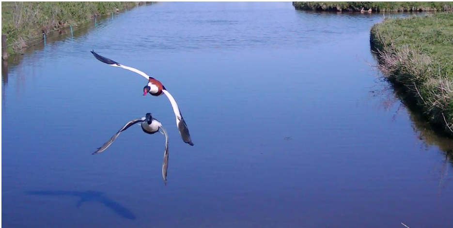
Bergeend verjaagt Slobbeend man (foto: bewegingscamera, 29 april 2026)

Zoiets geldt ook voor de bergeenden, we tellen er 18, maar daar zit vast wel een dubbeltelling bij. Deze eenden vliegen regelmatig op elkaar af om de ander uit 'hun' sloot te verjagen. Ze jagen ook alle andere watervogels uit hun stukje weg, zoals op onderstaande foto een slobbeend man.