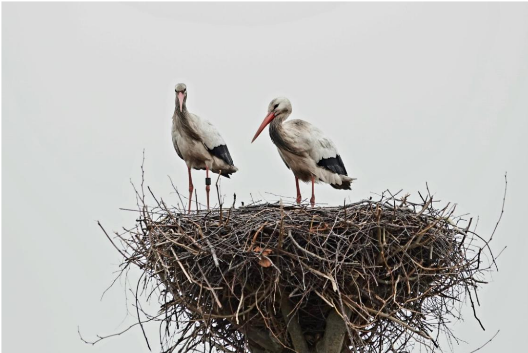
Ooievaars op het nest aan de Kadoelenweg (foto: Pieter Divendal, 22 februari 2026)

De Ooievaars van het nest in een boom aan de Kadoelenweg lijken inmiddels tot broeden te zijn overgegaan. We zien regelmatig een diep weggedoken Ooievaar over het randje van het nest de wereld inkijken.