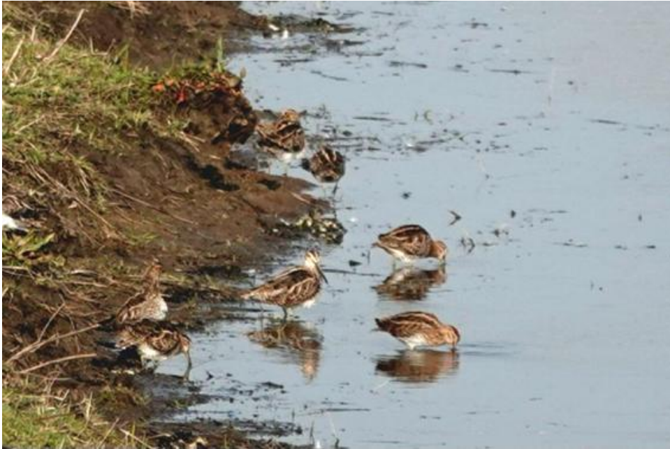
Watersnippen (23 maart 2026)

Er zijn vijf eendesoorten in de polder: Krakeenden, Wilde Eenden, Slobeenden, Wintertalingen en Smienten. De laatste twee soorten zullen over niet al te lange tijd naar hun broedgebieden in noordelijke streken vertrekken. De Wilde Eend broedt vanaf het vroege voorjaar in de polder, de Krakeend later in het seizoen. Vorig jaar heeft er voor het eerst een Slobeend gebroed in de polder. We hopen dat het paartje dat we nu zien ook dit jaar in de polder zal blijven en een nest zal gaan maken.