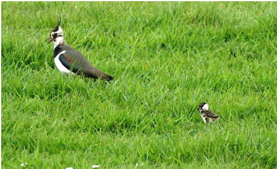
Kievit met kuiken (17 april 2026)

Er zijn heel wat kievitjongen uit het ei gekropen afgelopen week. Bij 11 paar kieviten zien we in totaal 29 jongen (vorige week bij 2 paar 6 jongen). De pulletjes kruipen regelmatig onder de vleugels van de ouders om op te warmen. De kievit zit dan hoger en ziet er breder uit dan de nestzitters.