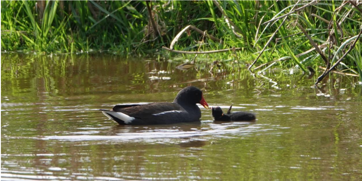
Waterhoen met kuiken (foto: Tom Jongeling, 26 april 2026)

Krakeenden zijn waarschijnlijk aan het broeden geslagen of ze zijn vertrokken naar elders, we zien er maar 6.