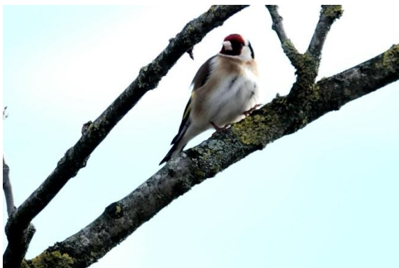
Putter (foto: Pieter Divendal, 5 april 2026)

We zien 3 grutto's rondlopen en 1 op het nest. Omdat we steeds 5 grutto's zagen de afgelopen weken zou het kunnen dat er ergens nog een grutto een nest heeft of maakt. Waarnemingen op andere momenten wijzen daarop: je ziet een grutto op steeds dezelfde plek in de weer met nestmateriaal.