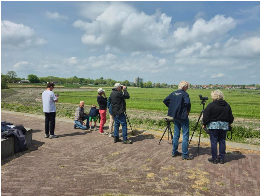
Vogels kijken met publiek (foto: Nynke de Vries, 2 mei 2026)

In de weilanden bloeit nog steeds de madelief volop en is ook al bloeiende boterbloem te zien en hier en daar op de oevers staat de gele lis mooi te zijn. Het talud van de dijk gaat steeds witter kleuren door het fluitenkruid met gele toefjes raapzaad ertussen. Daar begint nu overal de brandnetel en de inheemse berenklauw op te komen, die in de zomer de hele dijk bedekken.