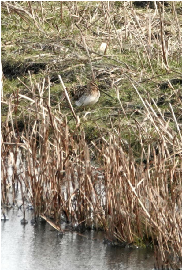
Watersnip (foto: Pieter Divendal, 3 februari 2026)

De Meerkoeten zijn met groot aantal in de polder; we zien op 4 plaatsen een bezet nest. De Waterhoenen zijn nog niet met de nestbouw begonnen. We krijgen vandaag net als vorige week zo'n 30 Watersnippin in de kijker.