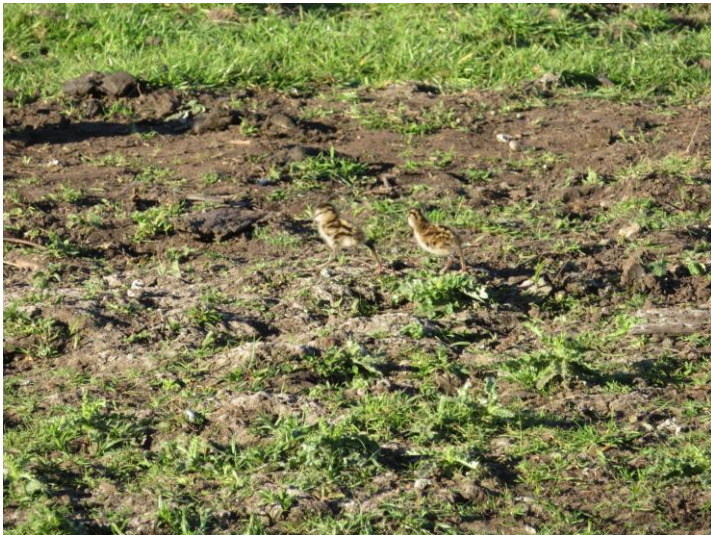
Twee jonge tureluurs (foto: Marty Vink, 2 mei 2026)

De tureluurs zijn wel degelijk aan het broeden geweest: in de ochtend van 2 mei is onderstaande foto van een tureluurpaar met 2 jongen gedeeld.