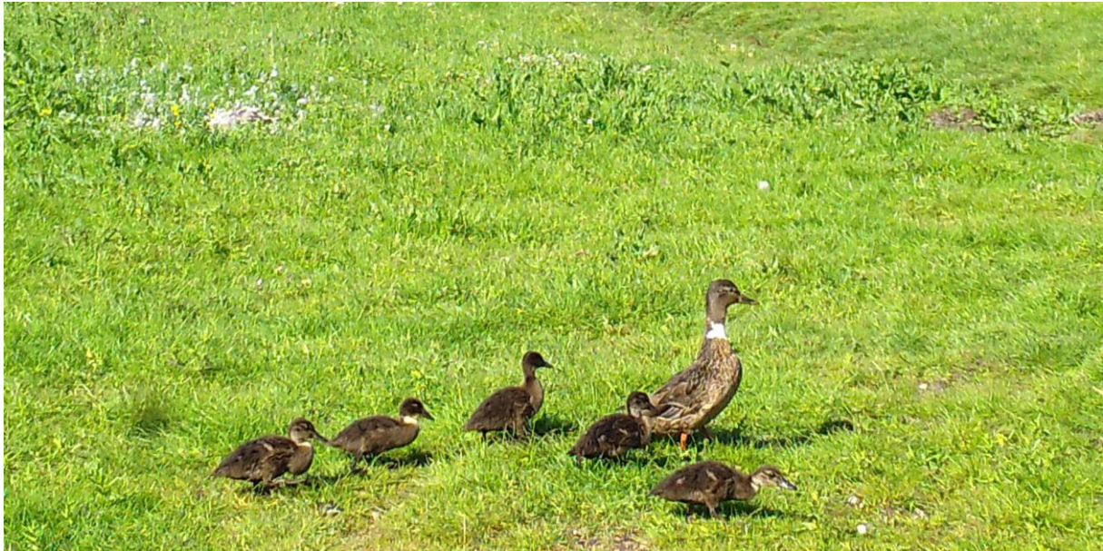
Wilde eend met kuijken; op de achtergrond 'geplukte' dode grauwe gans (foto: bewegingscamera, 7 mei 2026)

De grauwe gans blijft ons verbazen, zo'n overmacht aan jonge ganzen, we tellen er nu al 249. De andere vogels hebben geen last van deze ganzen, maar de boer en de koeien wel: ze poepen veel en gaan straks ook nog ruien. Bij het hooien wordt dat allemaal meegenomen in de balen en dat lusten de koeien niet.