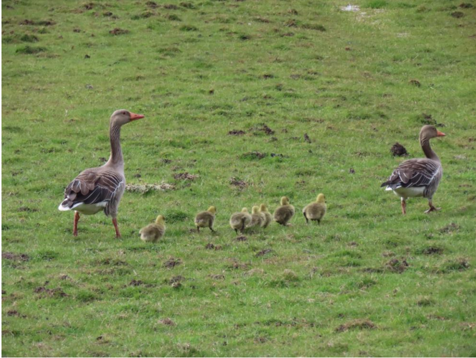
Grauwe Gans met 7 kuikens (foto: Martie Vink, 3 april 2026)

Het aantal adulte Grauwe Ganzen is wat lager dan vorige week, maar veel van de ganzen zijn aan het broeden. Er loopt zelfs al een eerste paar rond met 7 kleine kuikens tussen hen in. De 3 paren Nijlgans doen het nog rustig aan.