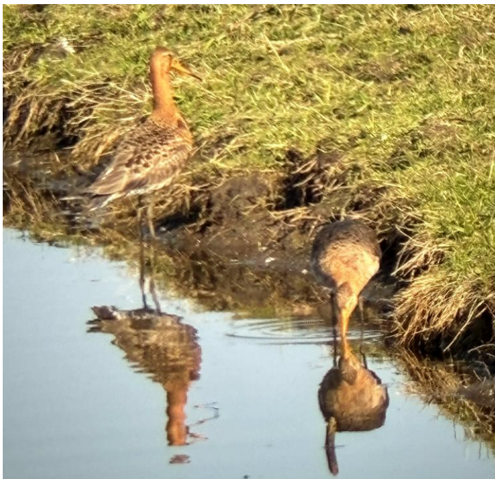
Grutto-paar (foto: 22 maart 2026, Michiel de Goeje)

Het aantal Grutto's is precies even groot als vorig jaar: er zijn twee paartjes en één 'losse' vrouw. Dat vrouwtje komt al een aantal jaren steeds terug, maar er is kennelijk geen mannetje dat haar het hof wil maken.