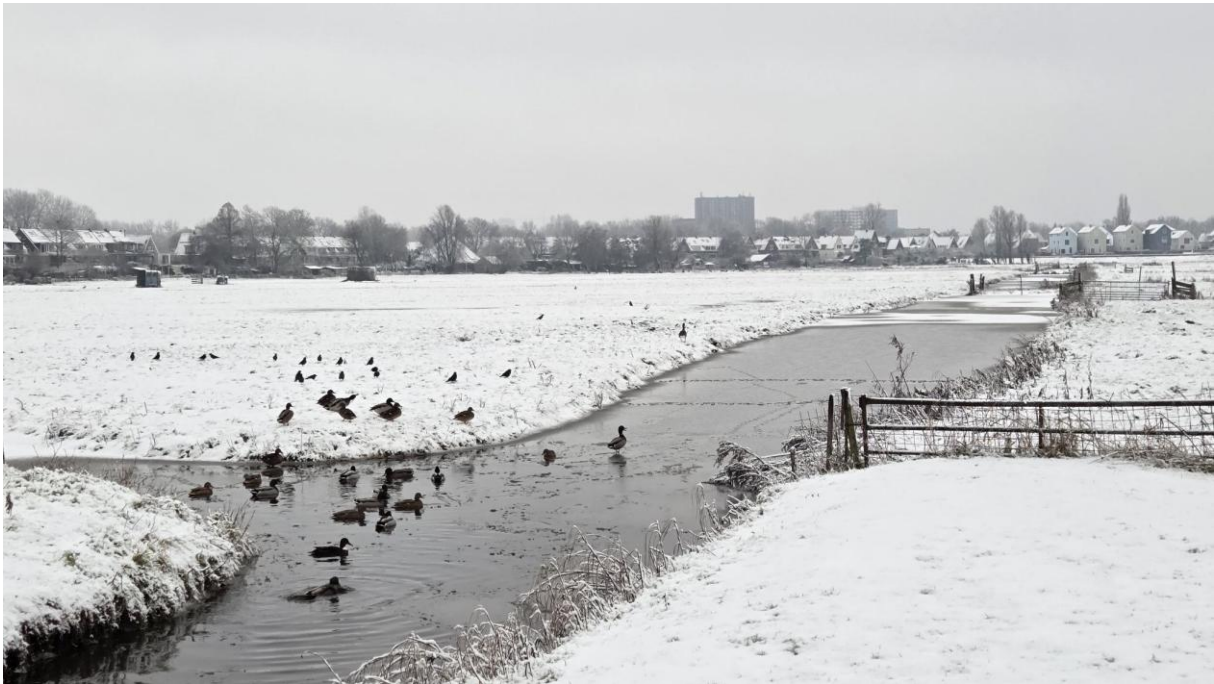
Winterfoto, zicht vanaf de Stoombootweg (foto: Harald Hooghiemstra, 5 januari 2026)

In januari en februari lag de grens tussen koud vriezend weer en wat warmer vochtiger weer langdurig over Nederland. Er viel regelmatig neerslag in de vorm van sneeuw. De polder werd enkele malen geheel wit. Het was kouder dan het langjarig gemiddelde, ook was het iets zonniger.