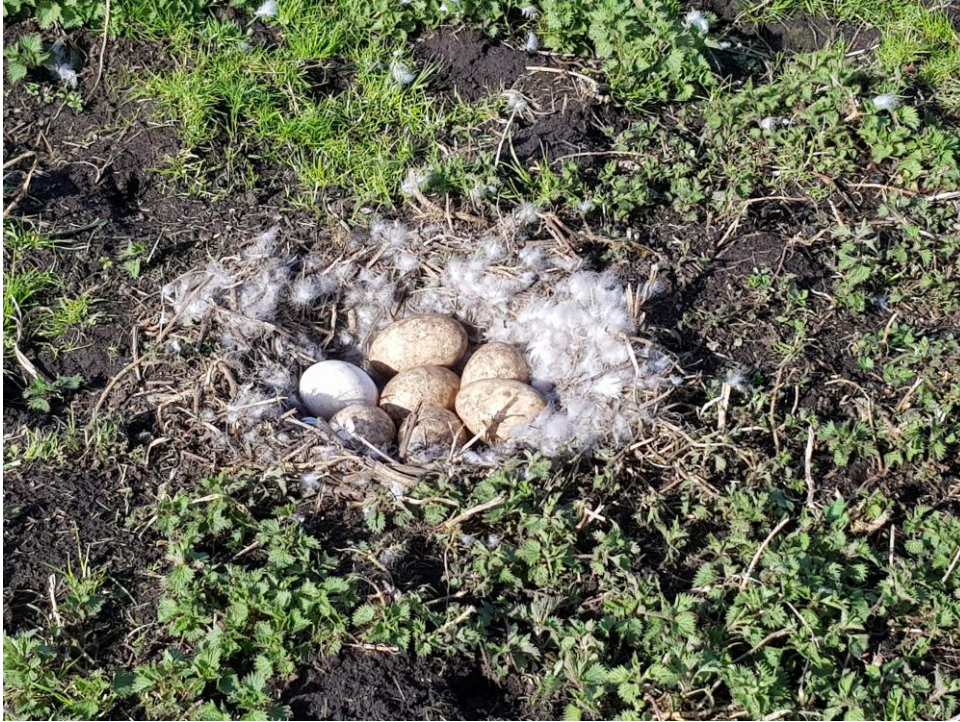
Ganzennest met 7 eieren (foto: 16 maart 2026)

Vandaag zien we vier Holenduiven tussen de Houtduiven zitten. Ze zijn iets kleiner dan de Houtduiven en hebben een mooie blauwgrijze kleur met roodpaarse halsvlek. We zien ook twee Turkse Tortels, een eerste Witte Kwikstaart en veel Spreeuwen. Verder zijn er vele vliegende rovers zoals Zwarte Kraai, Kauw, Ekster, Kleine Mantelmeeuw en Blauwe Reiger. Vandaag is er geen Lepelaar, zoals regelmatig het geval was in de afgelopen periode. Het ooievaarsnest in een boom aan het begin van de Kadoelenweg is inmiddels weer bezet (er zat regelmatig een paartje Nijlgans op het nest maar de Ooievaars lijken het pleit te hebben beslecht).