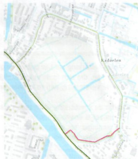
Figuur 1 Versterking Wilmkebreekpolder (paars gearceerd)

In de vorbereiding zal er een aantal keer onderzoek worden uitgevoerd door onze partners. Dit kan bestaan uit het nemen van grondboringen of het her-inmeten van het gebied.